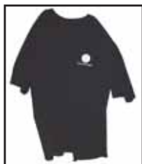
T-shirt 60 kr.

Hvis du mangler nogle laugseffekter, er du velkommen til at gå ind på Landslaugets hjemmeside, hvor du finder en oversigt.