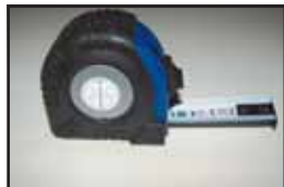
Målebånd 30 kr.