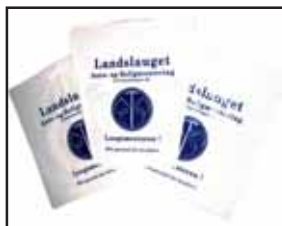
Plastposer 1 kr.